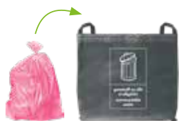
Sach pinc untro