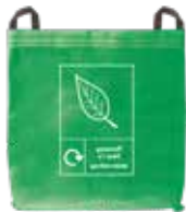
Sach dympi gwyrdd

Cysylltwch â ni i gofrestru ar gyfer y gwasanaeth casgliadau taladwy hwn