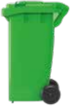
Bin ar olwynion gwyrdd