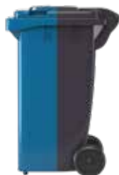
Bin ar olwynion du NEU fin ar olwynion glas